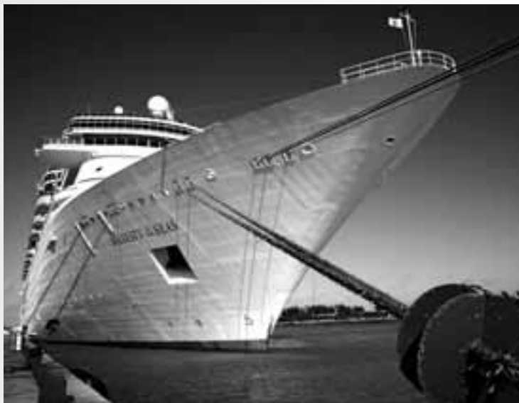
Majesty of the Seas: Luxus-Kreuzfahrtschiff mit unkonventionellen Passagieren

Die Metal-Kreuzfahrt „70 000 Tons of Metal“ ist ein Festival mit 40 Bands, die an Deck der „Majesty of the Seas“ auf der Bühne stehen: In Extremo, Nightwish, Alestorm, Hammerfall und viele mehr werden beim zweiten Festival auf See dabei sein. Nicht nur das Kreuzfahrtschiff