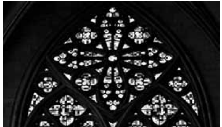
Das von Gerhard Richter gestaltete und 113 Quadratmeter große Fenster des Kölner Doms

Der in Dresden geborene Maler lebt in Köln und hat dort 2006/07 ein Fenster für den Dom entworfen,