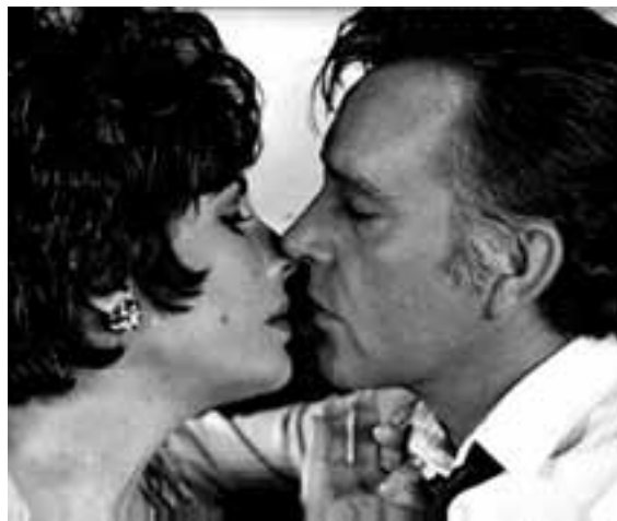
Sie küssten und sie schlugen sich: das Traumpaar Elizabeth Taylor und Richard Burton.

WDR 4_17:25 Flimmerkiste – Musik aus Film und Musical