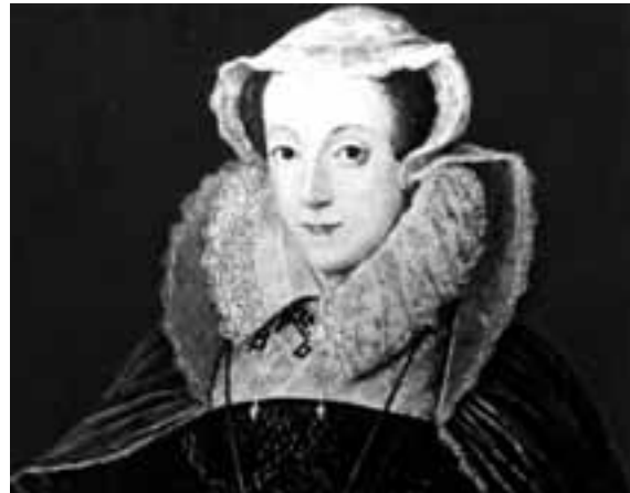
Maria Stuart

war, darüber ist viel gestritten worden. Ihr ganzes Leben war geprägt von Machtkämpfen, Intrigen, Blut und Tod. Noch keine Woche war Maria alt, als ihr Vater starb und sie Königin von Schottland wurde. Mit 15 Jahren heiratete sie den französischen Thronfolger, mit 16 wurde sie Königin von Frankreich, mit 18 kehrte sie als Witwe nach Schottland zurück, in ein von Religionskämpfen zerrissenes Land. Sie vermählte sich mit einem nichtsnutzigen Cousin, der zwei Jahre später von Verschwörern ermordet wurde. Wie weit Maria Stuart daran beteiligt war, ist nicht sicher. Dass