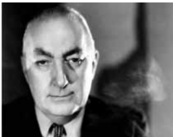
Edgar Wallace