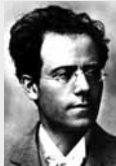
Gustav Mahler