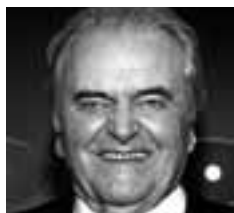
Chet Atkins, David Rose und Max Greger