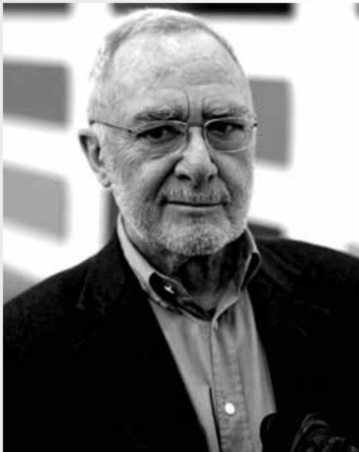
Gerhard Richter gilt als teuerster lebender Maler der Welt – er selbst findet das „absurd“.