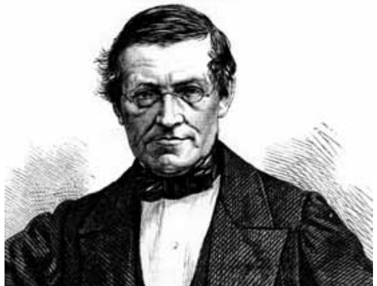
Charles Wheatstone, Erfinder der Konzertina und der Telegrafie