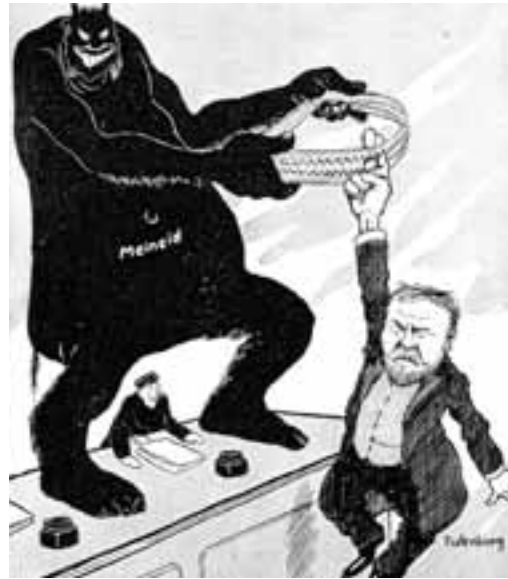
Karikatur zur Eulenburg-Affaire (1908): Aus einer politischen Attacke wurde eine private Katastrophe.

Dieser war eigentlich ein Schöngest und Schriftsteller, de facto jedoch Politiker und Diplomat, der den Kaiser von 1888 an privat und politisch gestützt und beraten hatte. Hardens Anwürfe zielten dabei nicht so sehr auf die Homosexualität des achtfachen Familienvaters. Mit Eulenburg wurde ein herausragender Vertreter einer Politik attackiert, die das Bismarck'sche Erbe einer Defensive nach außen verteidigte und das Kaiserreich für eine Berliner „Weltpolitik“ noch nicht reif sah, die Hardens Generation wiederum ersehnte.