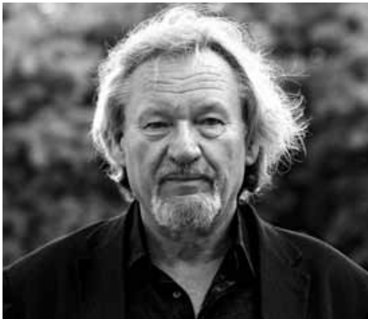
Der Kulturforscher Prof. Dr. Klaus Theweleit: Männerherrschaft und Frauenkörper