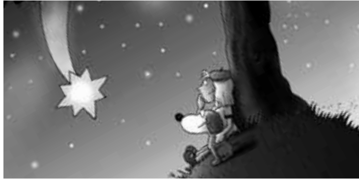
Heute reist die Bärenbude um 19.30 Uhr zu den Sternen: Es geht um Sterneentdecker und Sternschnuppen: Wenn man sie sieht, darf man sich bekanntlich was wünschen. Also, nicht verpassen!

00:00 – 06:00 WDR 5 Nachtaktiv 00:00 Nachrichten, Wetter 00:05 Politikum – Das Meinungsmagazin Wiederholung von Mittwoch 19:05 00:30 Profit – Das Wirtschaftsmagazin Wiederholung von Mittwoch 18:05 01:00 Nachrichten, Wetter Übernahme vom NDR 01:05 Westblick – Das Landesmagazin Wiederholung von Mittwoch 17:05 01:55 Hörtipps 02:00 Nachrichten, Wetter Übernahme vom NDR 02:05 WDR 5 LebensArt Live mit HörerInnen und Experten Wiederholung von Mittwoch 15:05 03:00 Nachrichten, Wetter Übernahme vom NDR 03:05 Tischgespräch Wiederholung von Mittwoch 20:05 04:00 Nachrichten, Wetter Übernahme vom NDR 04:05 WDR 5 – Tagesgespräch Wiederholung von Mittwoch 09:20 04:45 Neugier genügt Wiederholung von Mittwoch 10:05 Darin: 05:00 Nachrichten, Wetter 06:00 Nachrichten, Wetter, Verkehrslage 06:05 Morgenecho Darin: 06:26 07:26 08:26 Deutsche Pressestimmen 06:30 07:00 07:30 08:00 08:30 Nachrichten, Wetter, Verkehrslage 06:55 Kirche in WDR 5 Pfarrerin Kathrin Koppe-Bäumer, Meschede 08:55 Hörtipps 09:00 Nachrichten, Wetter, Verkehrslage 09:05 ZeitZeichen Stichtag heute: 09. Februar 1932