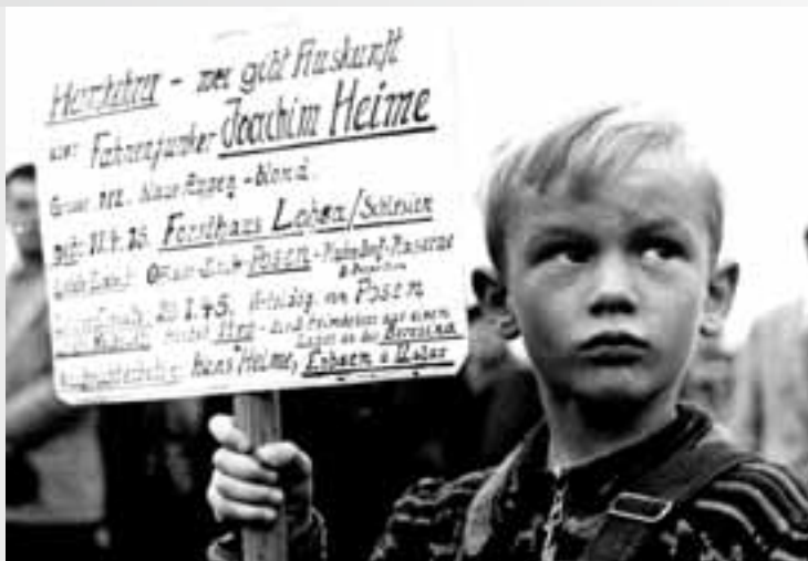
Kind sucht Vater (1955) – in den Nachkriegsjahren ein alltägliches Bild.

Von Sabine Bode Die Generation der Nachkriegskinder ist in die Jahre gekommen. Sie haben mehr Zeit als früher, so auch für eine Rückschau. Da tauchen Fragen zum Vater, zu seinem Tun und zu seinem Schweigen auf. Zur Klärung der eigenen Identität wollen die Nachkriegskinder endlich wissen, ob er Täter oder Opfer war und was sie von ihm „geerbt“ ha-