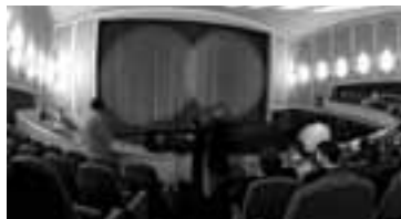
Lichtburg Essen: Auch typisch deutsche Filme haben hier Premiere.

WDR 5_12:05, 21:05 Scala – Aktuelles aus der Kultur