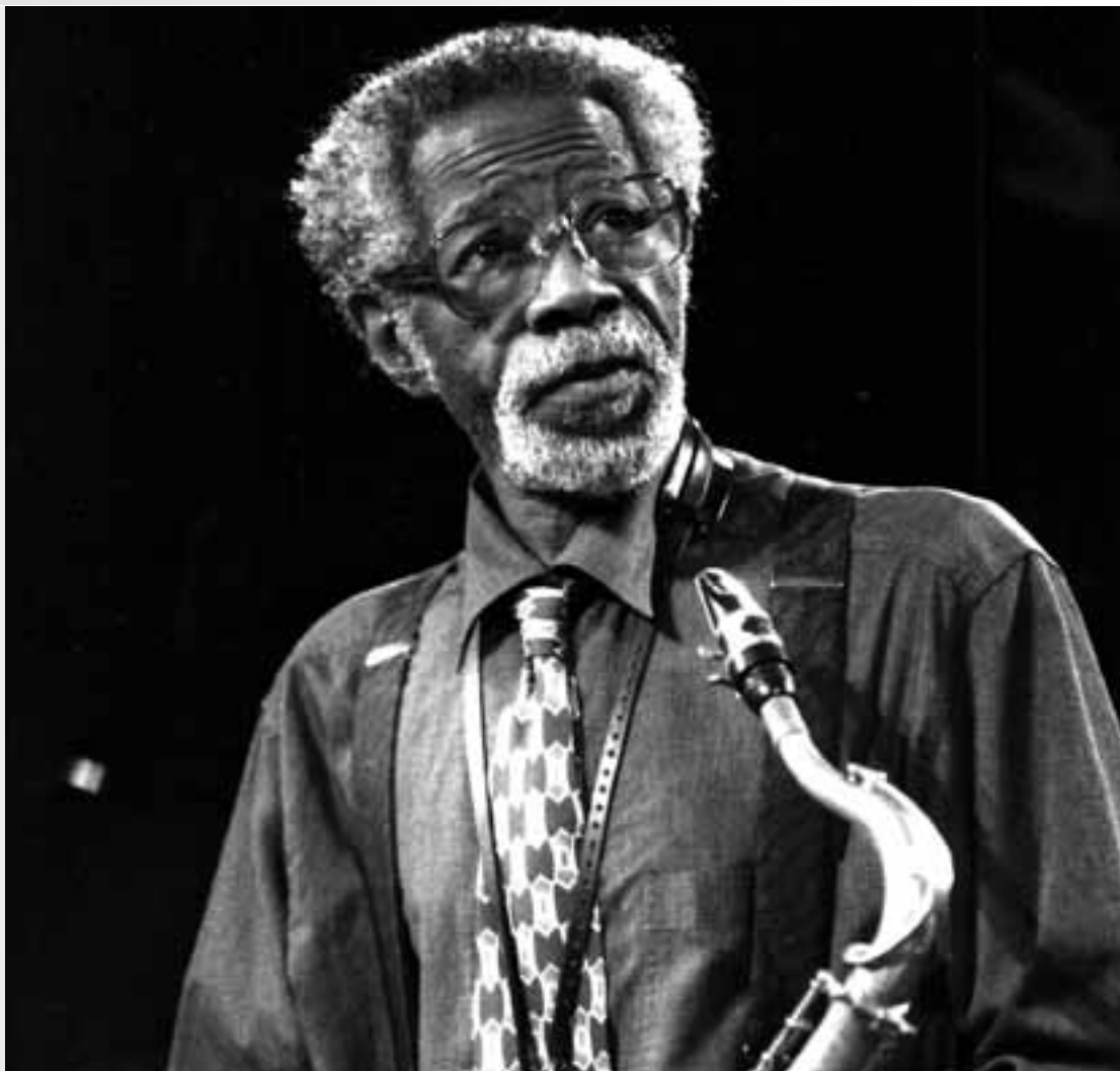
WDR 3 Jazz präsentiert heute auch Joe Hendersons Reflexionen zu George Gershwins „Porgy and Bess“.