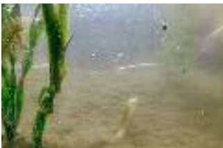
Auffälliges Schwimmverhalten infizierter Killifische