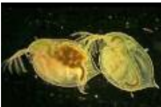
Links ein gesunder Wasserfloh mit vielen gelblichen Eiern, rechts ein infizierter Wasserfloh ohne Eier

Theoretisch sollten sich Wirte und Parasiten also in einem ewigen Katz-und-Maus-Spiel immer aneinander anpassen. Leider ließ sich das bisher nicht überprüfen, denn der Prozess wird erst nach vielen Generationen sichtbar. Doch Forschern aus der Schweiz und aus Belgien ist es jetzt erstmals gelungen, diese Anpassung live zu beobachten.