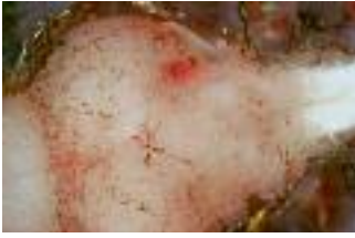
Völlig von Parasitenzysten umhüllt: Gehirn eines infizierten Killifisches