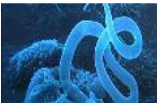
Komplexes Zusammenspiel: Würmer und menschliche Immunzellen