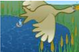
Ein Wechsel-Parasit kann immer neue Gebiete erobern

Trotz aller Schwierigkeiten kann es auch dem Fisch-Parasiten gelingen, ein ganzes Gebiet einzunehmen, sprich alle Fische in einem See zu infizieren. Doch dann kommt er nicht weiter – er ist auf diesen einen See beschränkt.