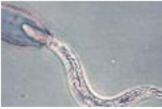
Junger Schweinepeitschenwurm, der gerade seine Eizelle verlässt

Können Parasiten gegen Allergien helfen?