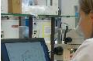
Wenn der Parasit aus demselben Jahrgang stammt wie der Wirt, ist er für den Wirt besonders gefährlich

Im Labor bringen die Forscher zum Beispiel Wasserflöhe von 1990 einmal mit Parasiten von 1990 zusammen, ein anderes Mal mit Parasiten von 1985. Dieser direkte Vergleich bestätigt die These: Tatsächlich werden wesentlich weniger Wasserflöhe von den Parasiten aus der Vergangenheit infiziert als von den aktuellen Parasiten. Dieses Ergebnis zeigt sich bei allen Kombinationen, also nicht nur für die Jahre 1985 und 1990. Die Wasserflöhe passen sich also offenbar immer an die Parasiten an, in dem sich ihr Immunsystem verändert. Gleichzeitig ändert sich auch der Parasit ständig und kann somit das aufgerüstete Immunsystem erneut überwinden.