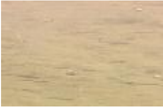
Von Parasiten gesteuert? Kalifornische Killifische

Wie Parasiten das Verhalten ihrer Wirte manipulieren