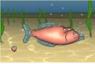
Raumnot im Fisch

Dem Fisch-Parasiten wird die geringe Größe seines Wirts sogar ein weiteres Mal zum Verhängnis. Denn irgendwann wird es richtig eng. Auch wenn der Fisch-Parasit schließlich fast den kompletten Fisch ausfüllt, so bleibt er absolut gesehen doch klein. Von der Größe des Parasiten hängt jedoch ab, wie viele Eier er produzieren kann. Die kleine Körpergröße des Wirts bedeutet für den Fisch-Parasiten also wenig Nachwuchs.