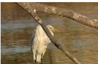
Ein Wasservogel späht nach Killifischen

Es hängt mit dem Lebenszyklus des Parasiten zusammen: Für seine unterschiedlichen Entwicklungsstadien benötigt der Saugwurm gleich drei Wirte im Biotop des Carpenteria Salt Marshs. Die Eier des Parasiten werden mit Vogelkot über das Biotop verteilt, wo sie von aber tausenden Hornschnecken gefressen werden. Der Parasit nutzt die Schnecken als Brutstätte für die nächste Entwicklungsstufe: die frei schwimmenden Larven. In Massen verlassen diese mikroskopisch kleinen, quasi unsichtbaren Larven die Schnecke und machen Jagd auf Killifische: Sie dringen durch die Kiemen ein und besetzen das Gehirn der Fische. Doch um sich als erwachsene Saugwürmer wieder zu paaren und Eier zu legen, müssen die Parasiten unbedingt in den Körper der Wasservogel. Für den Parasiten ist es also überlebenswichtig, dass der Fisch, in den er eingedrungen ist, tatsächlich von Vögeln gefressen wird.