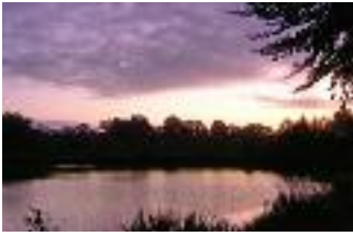
In diesem See findet ein evolutionäres Wettrüsten statt

Wie Parasiten die Evolution beeinflussen haben