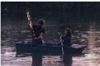
Vom Boot aus in die Vergangenheit

Sowohl die Wasserflöhe als auch die Bakterien haben zusätzlich zu ihrer kontinuierlichen Vermehrung eine weitere Überlebensstrategie: Sie bilden sogenannte Dauerstadien. Die Wasserflöhe legen Eier, die auf den Seeboden absinken und dort Jahrzehnte überdauern können. Und die Bakterien bilden Sporen aus, eine Art kleine Kapseln, die ebenfalls Jahrzehnte überleben können. Sowohl Eier als auch Sporen versinken mit der Zeit im Schlack am Grund des Sees.