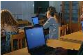
In Reaktionstests schnitten Personen, die mit Toxoplasma infiziert sind, schlechter ab als nicht Infizierte