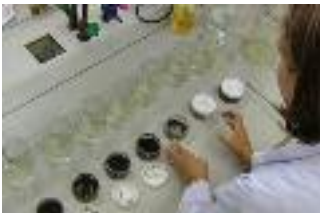
Lässt sich die Evolution im Labor nachstellen?

In freier Natur trafen natürlich immer nur die Paare desselben Jahrgangs aufeinander, sprich: Ein Wasserfloh von 1985 zum Beispiel musste sich nur gegen Bakterien wehren, die ebenfalls von 1985 stammten. Die Evolutionsforscher vermuten: Bei diesem Zusammentreffen haben nur jene Wasserflöhe überlebt, deren Immunsystem die Parasiten erfolgreich abwehren konnte. Und sie haben diese Fähigkeit an ihre Nachkommen weitergegeben. Die Wasserflöhe einer späteren Generation – zum Beispiel von 1990 – sollten also gut gegen die Parasiten von 1985 gewappnet sein. In der Natur lässt sich diese Theorie aber nicht prüfen, da sich ja inzwischen auch die Parasiten ihrerseits an das Immunsystem der Wasserflöhe angepasst haben. Der Test findet daher im Labor statt.