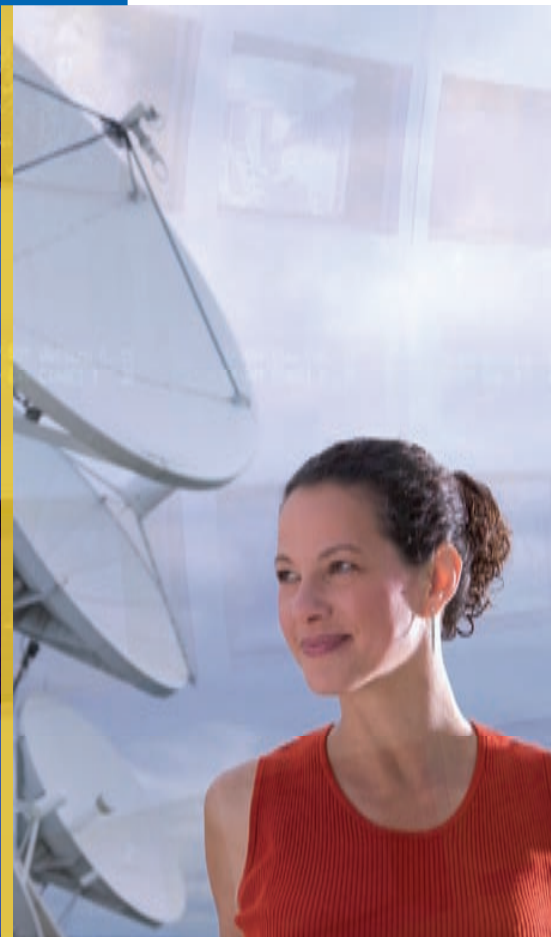
Bildnachweis: Titel © Mauritius, Innen © Mauritius, was/H, Sachs, wdr/JS, Voßköhler, wdr/A, Fußwinkel, was/Mauer, was/Kilian, was/Heiden Oktober 2007, Herausgegeben vom Westdeutschen Rundfunk Köln Verantwortlich: Öffentlichkeitsarbeit

»Ich bin gerne beim wdr, weil ich als Projektleiterin verantwortungsvolle und abwechslungsreiche Aufgaben für die unterschiedlichsten Fachbereiche habe und trotzdem noch Zeit für meine Familie finde.«