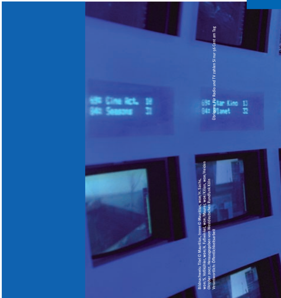
Übrigens: Für Radio und TV zahlen Sie nur 56 Cent am Tag

Der wdr bietet ein attraktives Arbeitsumfeld und fördert die Vereinbarkeit von Beruf und Familie. Teilzeitbeschäftigung oder Fortbildungen während und nach der Elternzeit, ein betriebseigener Kindergarten sowie die Förderung von weiblichen Führungskräften sind nur einige Beispiele dafür.